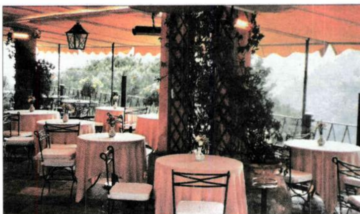
Leere Terrasse, weil es den Gästen draussen zu frisch ist? Diese Zeiten sind vorbei. Durch die Infrarot-Heizstrahler (oben an der Säule) kann dieser Bereich ohne grossen Energieverlust erwärmt werden.